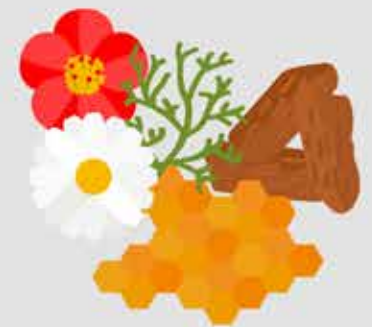
POLIPLANT CABELLO NORMAL GBNB

Una fórmula natural que hidrata el cabello, nutre el cuero cabelludo y fortalece la raíz. Deja el pelo fresco, suave, fuerte y flexible.